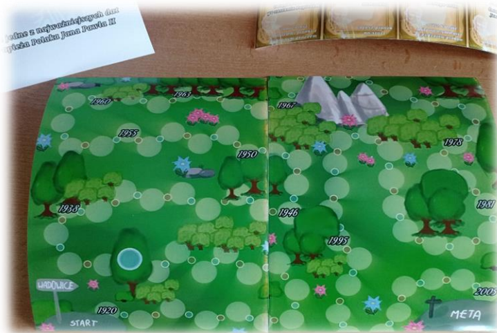
Tekst i fot.: B.Z.